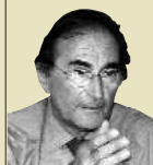
EMILIO LAMO DE ESPINOSA